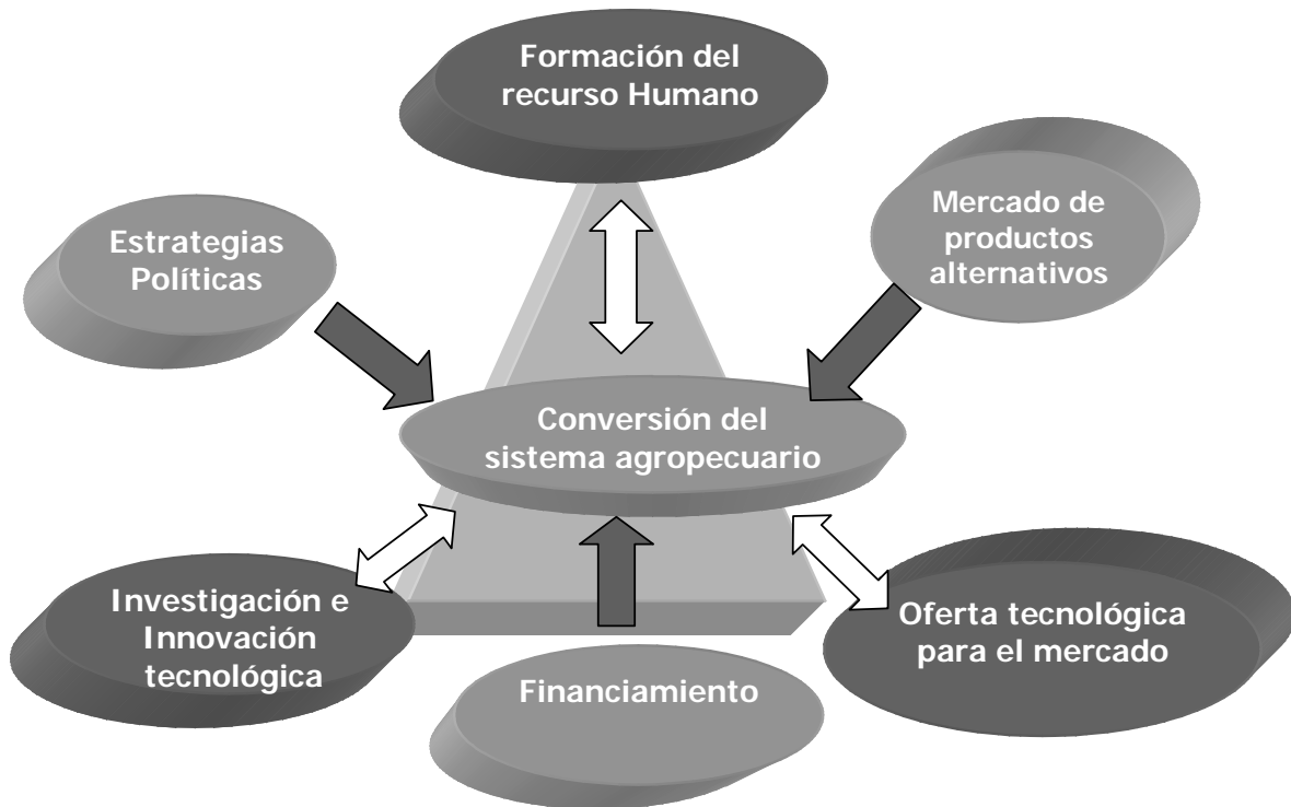
Figura 5.1 Esquema de políticas para transitar hacia la sustentabilidad de la actividad agropecuaria.